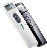
TimeControl TC445-II 5-Kanal Handsender mit integrierter Zeitschaltuhr

Bringen Sie Ihre Rollläden in Bewegung, ohne sich selbst bewegen zu müssen: Mit nur einem Tastendruck auf Ihrem Handsender, der über Funk alles Weitere für Sie erledigt. Oder Sie mögen es noch bequemer und überlassen die Arbeit direkt einer Zeitschaltuhr. Einmal einstellen, fertig. Genießen Sie den Komfort und den Vorteil, dass Ihnen dank störunempfindlicher Frequenz nichts dazwischen funkt – mit BECKER.