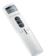
TimeControl TC4410-II 10-Kanal Handsender mit integrierter Zeitschaltuhr