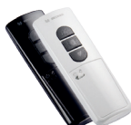
MemoControl MC441-II 1-Kanal Memory-Handsender